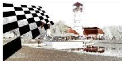
OROSHÁZI SAKK EGYESÜLET

Megemlékezés a verseny névadójáról; Megyebajnoki cím és helyezések eldöntése; Értékszám szerzés, módosítás biztosítása; A sakk játék népszerűsítése; Baráti kapcsolatok ápolása.